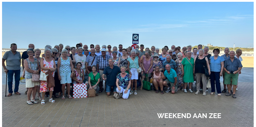
WEEKEND AAN ZEE