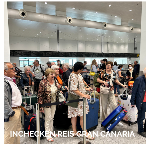
INCHECKEN, REIS GRAN CANARIA